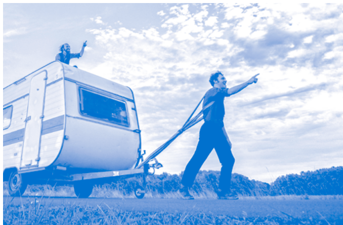
Cara C ie

Voilà deux gars en mouvement ! De passage. Ciao ! Salut, bonjour, au revoir. C'est trop court ? Non, c'est intense, même généreux. Les balles s'échangent dans d'improbables rebondissements, la poésie surgit de la simplicité, leur complicité devient contagieuse. Ils sont sur la route, avec leur boîte roulante, allant vers l'irrésistible inconnu. 50 minutes, ouvert à tous