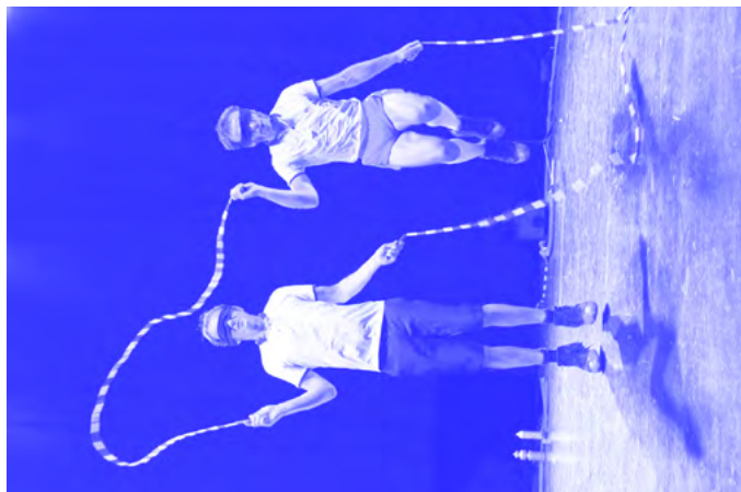
C ie Facile d'Excès

Un duo prêt à tout, à tout ce dont ils se sentent capables ! De la démesure tout en finesse. Ce qui compte, c'est l'ascension, l'objectif n'étant pas de devenir célèbre mais quelqu'un. Un moment de légèreté où prime le rapport direct avec le public. 35 minutes, ouvert à tous