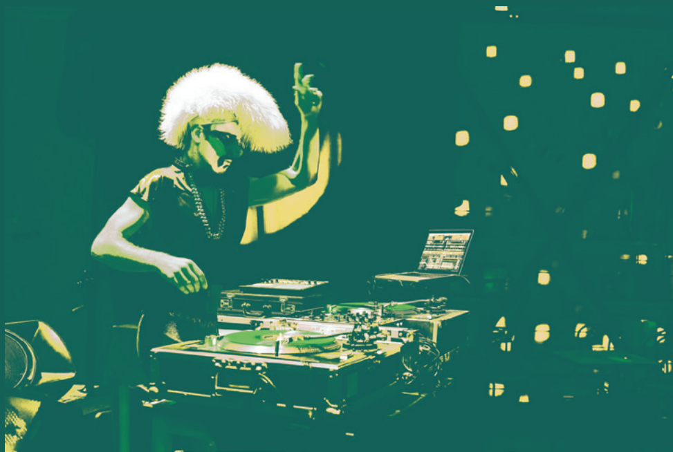
Cie Les Enfants Sérieux — Sirius Down