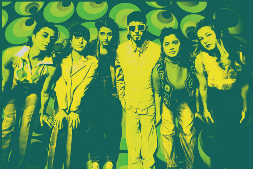
Collectif TBTF — Fame