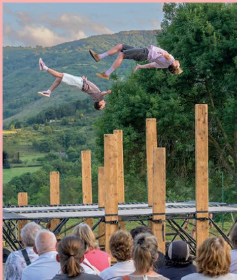
La Contrebande – Cian Cabarre © Daniel Michelon