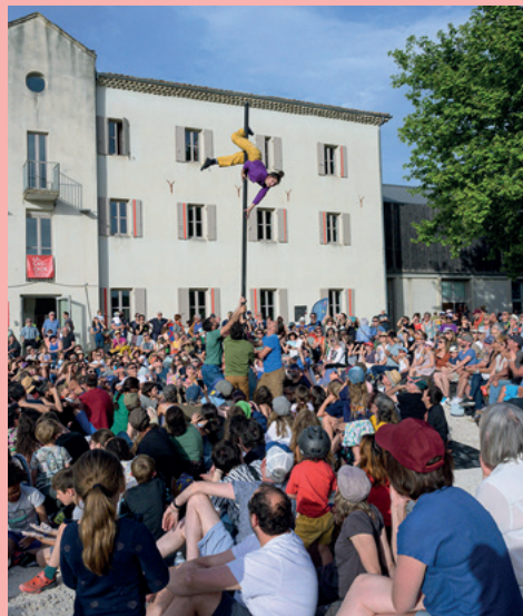
Cie ADMVZW – 1e KW © Daniel Michelon